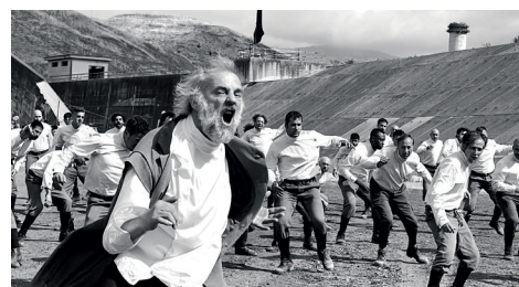
01 The End di Joshua Oppenheimer.