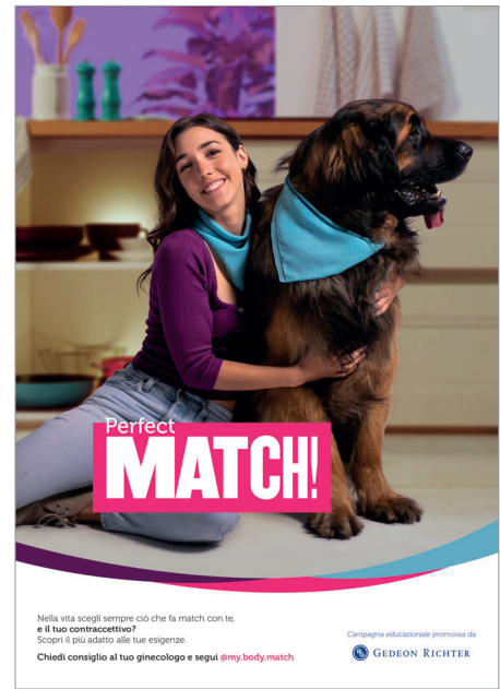
GEDEON RICHTER 'MY BODY MATCH' – CAMPAGNA STAMPA