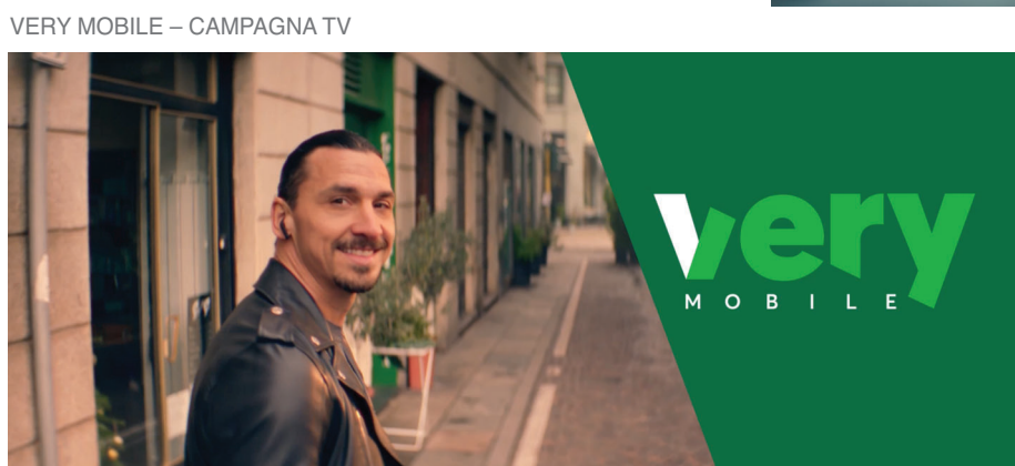
VERY MOBILE – CAMPAGNA TV