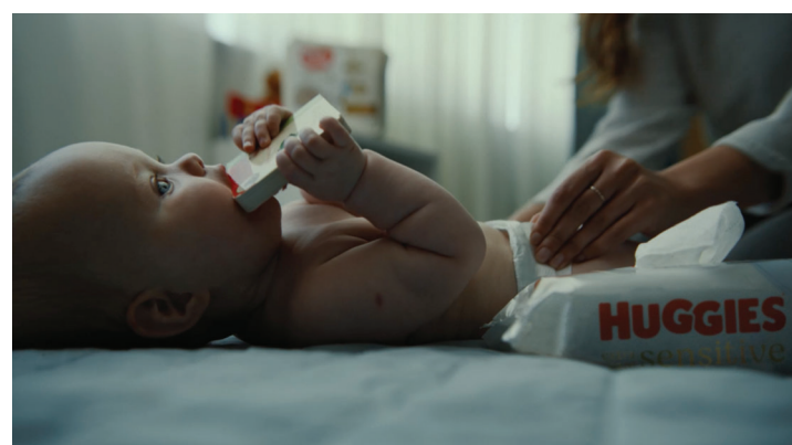
HUGGIES – CAMPAGNA TV