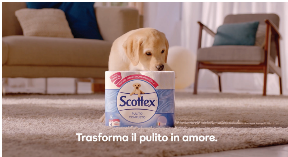
SCOTTEX – CAMPAGNA TV