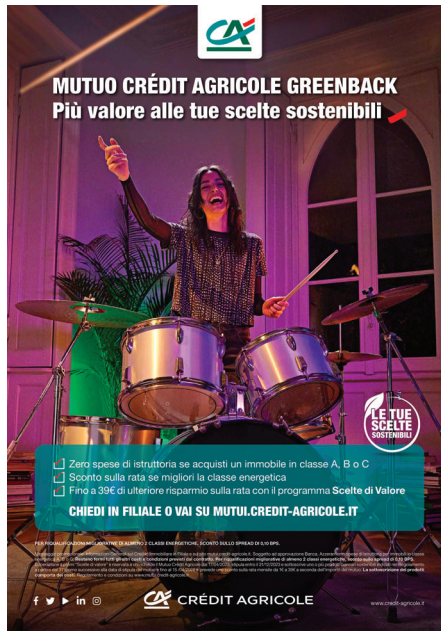
CRÉDIT AGRICOLE 'MUTUO-BATTERIA' – CAMPAGNA STAMPA

ALTO ADIGE AMPLIFON ARCADIA YACHTS ASUS BERKEL BW ADVISOR CONI CRÉDIT AGRICOLE E-GAP GEDEON RICHTER HAIER EUROPE HALEON IBSA MONTENEGRO – GIN EDGAR SOPPER I LIQUORI DELLA TRADIZIONE ITALIANA NWG KIMBERLY CLARK – SCOTTEX – HUGGIES PIETRO FIORENTINI SALOV – FILIPPO BERIO VERY MOBILE XIAOMI