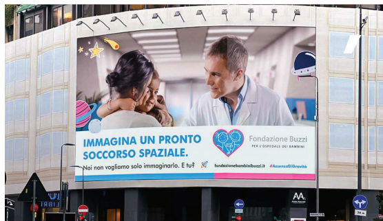
FONDAZIONE BUZZI – OOH