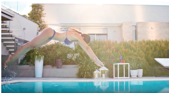
PISCINE CASTIGLIONE – SPOT TV