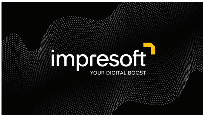
IMPRESOFT – BRANDING