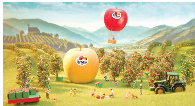
VAL VENOSTA - IL PARADISO DELLE MELE – SPOT WEB