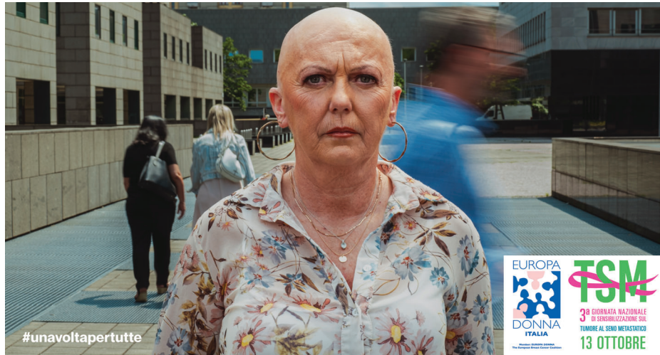
EUROPA DONNA – SPOT TV