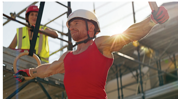
MILWAUKEE – SPOT TV