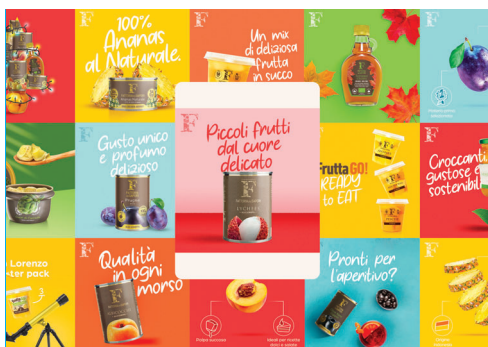
FATTORIA DEI SAPORI – CREATIVITÀ