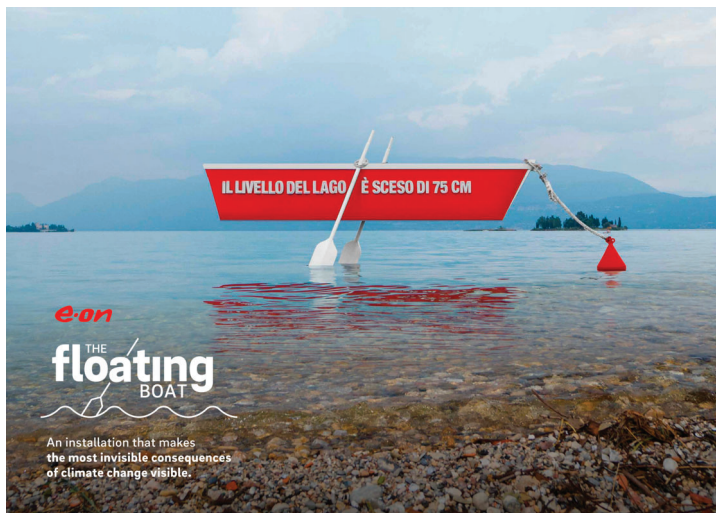
E.ON – ACTIVATION 'THE FLOATING BOAT'