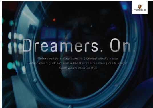
PORSCHE – PIATTAFORMA DI BRANDED CONTENT 'DREAMERS ON'