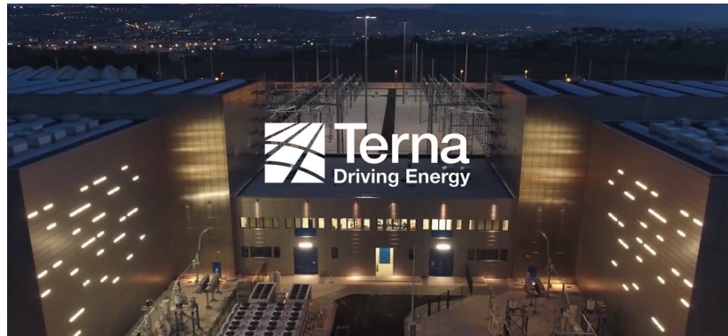
TERNA – CAMPAGNA NAZIONALE 'NOI SIAMO ENERGIA'