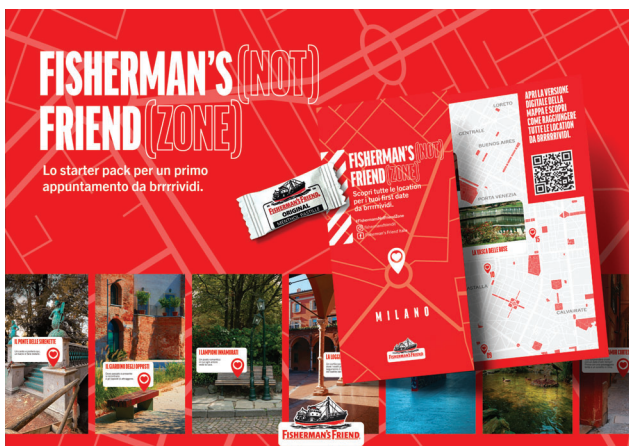
FISHERMAN'S FRIEND – SOCIAL ACTIVATION FISHERMAN'S (NOT) FRIEND (ZONE)