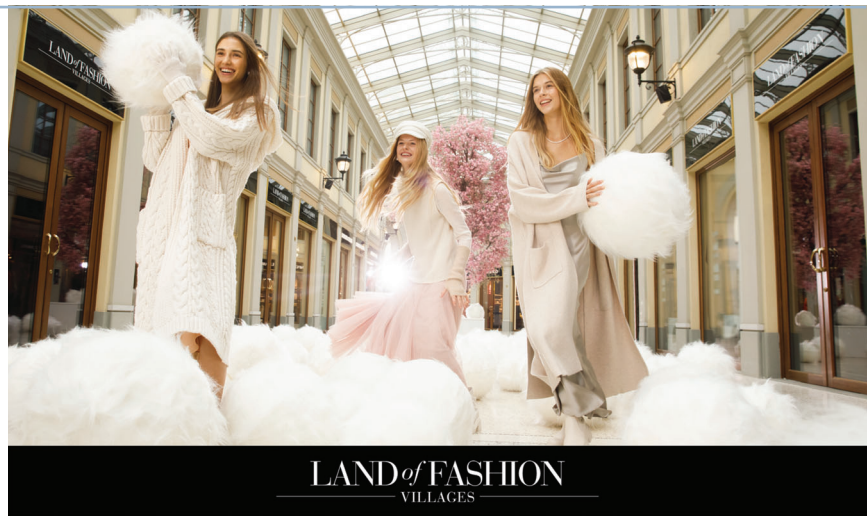
LAND OF FASHION – WINTER CAMPAIGN 2023-2024