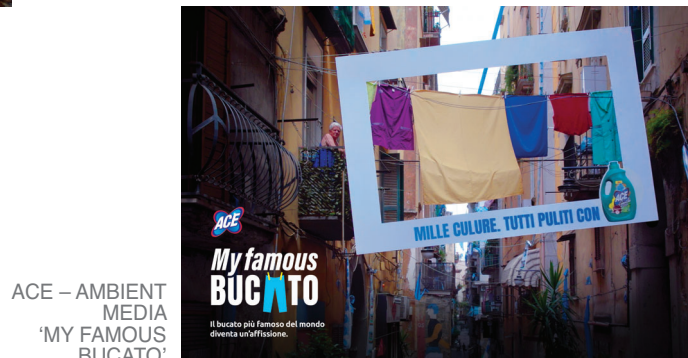
ACE – AMBIENT MEDIA 'MY FAMOUS BUCATO'